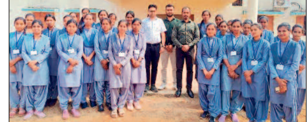
हरिभूमि न्यूज ►► फिंगेश्वर